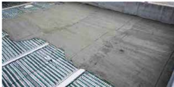
IZOLAREA PLASEI DE DEGIVRARE

Fibra de carbon este flexibila, nu se oxideaza, nu produce emisii electromagnetice periculoase in timpul fluxului de energie electrica, nu isi modifica dimensiunile in timpul variatiilor de temperatura si nu isi modifica rezistenta ohmica. Nu se uzeaza si nu necesita mentenanta. Datorita rezistivitatii mari a fibrei de carbon, generarea energiei termice se face rapid si eficient, permitand economii importante de energie electrica.