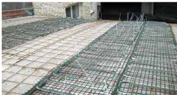
CONEXIUNE INTRE PLASA DE DEGIVRARE SI PLASA METALICA