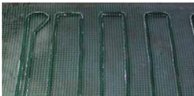
PLASA SUBTIRE DE 1X1 cm