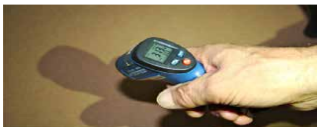
VERIFICAREA TEMPERATURII LA SUPRAFATA