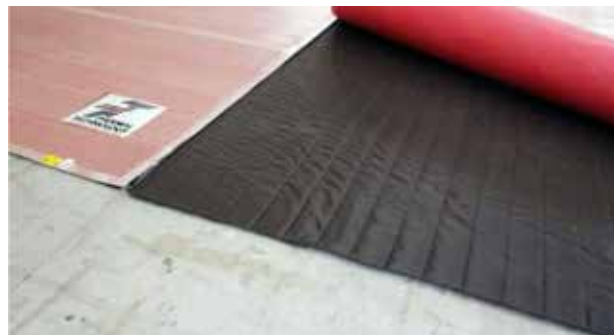
ELEMENTE INCALZITOARE PESTE IZOLATIA TERMICA

Fibra de carbon este flexibila, nu se oxideaza, nu produce emisii electromagnetice periculoase in timpul fluxului de energie electrica, nu isi modifica dimensiunile in timpul variatiilor de temperatura si nu isi modifica rezistenta ohmica. Nu se uzeaza si nu necesita mentenanta. Datorita rezistivitatii mari a fibrei de carbon, generarea energiei termice se face rapid si eficient, permitand economii importante de energie electrica.