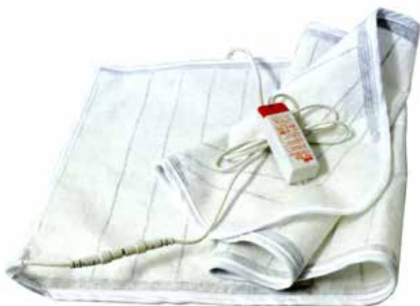
STIROFACILE CU TRANSFORMATOR CONECTAT