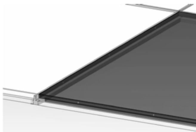
PANOU INCALZITOR MONTAT IN RAMA METALICA A TAVANULUI FALS