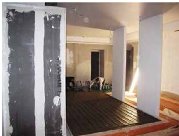
APLICAREA PLASEI INCALZITOARE

Fibra de carbon este flexibila, nu se oxideaza, nu produce emisii electromagnetice periculoase in timpul fluxului de energie electrica, nu isi modifica dimensiunile in timpul variatiilor de temperatura si nu isi modifica rezistenta ohmica. Nu se uzeaza si nu necesita mentenanta. Datorita rezistivitatii mari a fibrei de carbon, generarea energiei termice se face rapid si eficient, permitand economii importante de energie electrica.