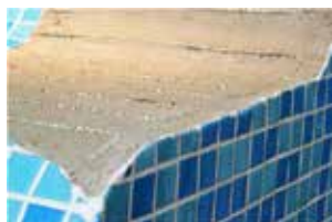
PARTICULARITATILE APLICARII PLASEI INCALZITOARE