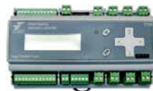
CONTROLER T705 (VEZI ACCESSORII)