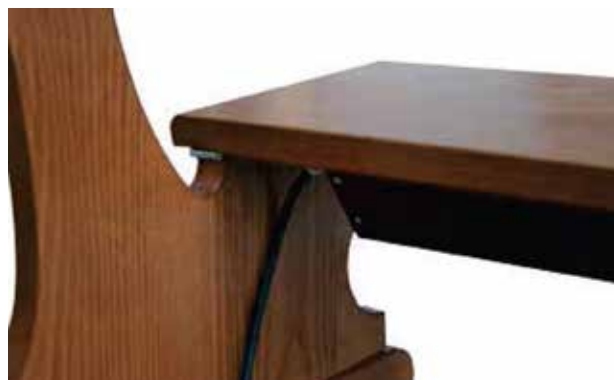
PANOU RADIANT FIXAT SUB BANCA